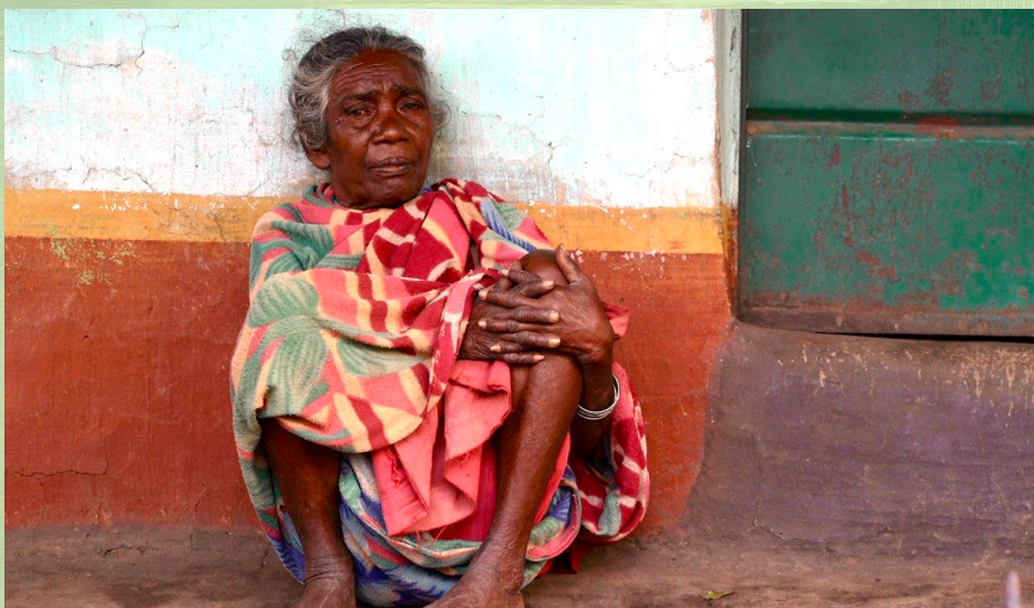
Habitantes de la reserva de tigres de Similipal.

El Proyecto del Tigre de 1973 ha provocado el desplazamiento a gran escala de los Pueblos Indígenas, a menudo sin el debido CLPI ni reparaciones adecuadas, dejando a las comunidades indígenas expuestas al acoso, la violencia e incluso la muerte.