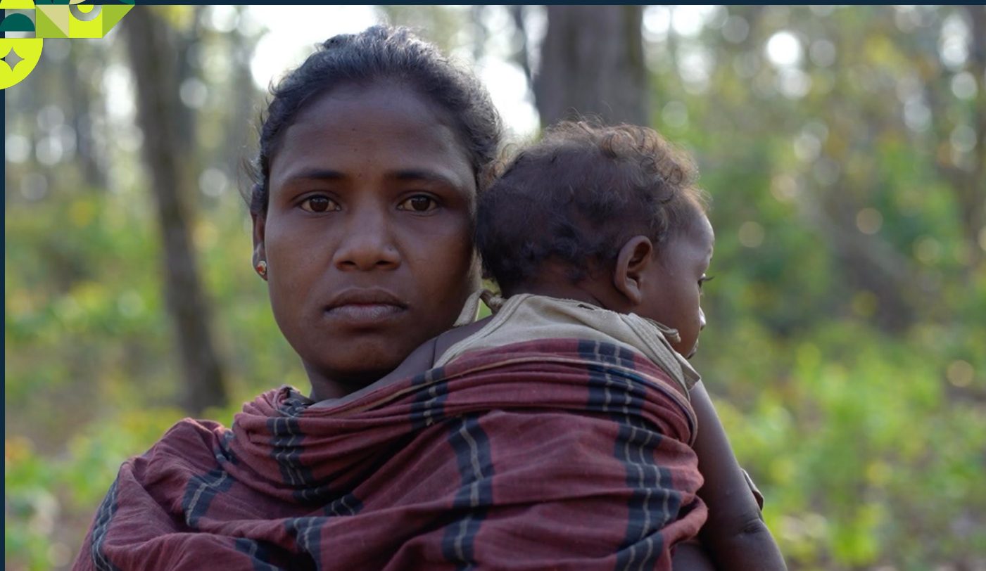
Habitantes de la reserva de tigres de Similipal.

nacional y local. Lo que se necesita urgentemente es un marco jurídico coherente que garantice que todas las leyes medioambientales y de conservación estén plenamente en consonancia con las obligaciones internacionales en materia de derechos humanos. Sin esa coherencia jurídica, los elevados compromisos adquiridos en los foros internacionales corren el riesgo de convertirse en promesas huecas.