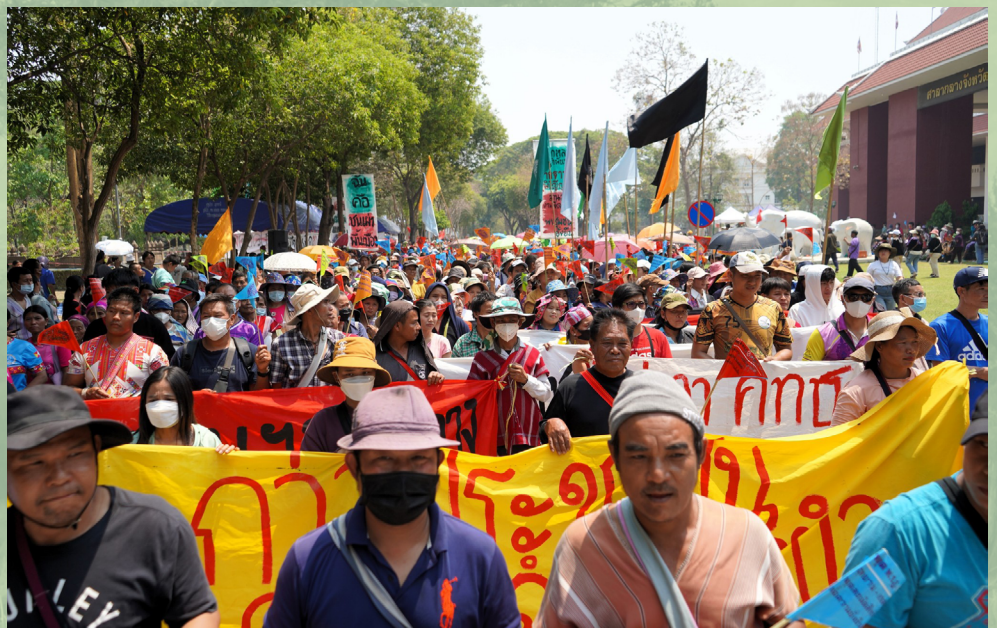
Los pueblos indígenas y las comunidades que viven en los bosques se reunieron frente al Ayuntamiento Provincial de Chiang Mai para exigir modificaciones en las leyes forestales que afectan a las comunidades.

La Ley de Parques Nacionales de 2019 exacerbó las violaciones contra los Pueblos Indígenas al no reconocer sus derechos sobre la tierra y sus prácticas tradicionales, lo que condujo a un aumento de la criminalización, los desalojos forzados y los conflictos por tierras ancestrales, a pesar de una sentencia del Tribunal Supremo Administrativo de 2018 que