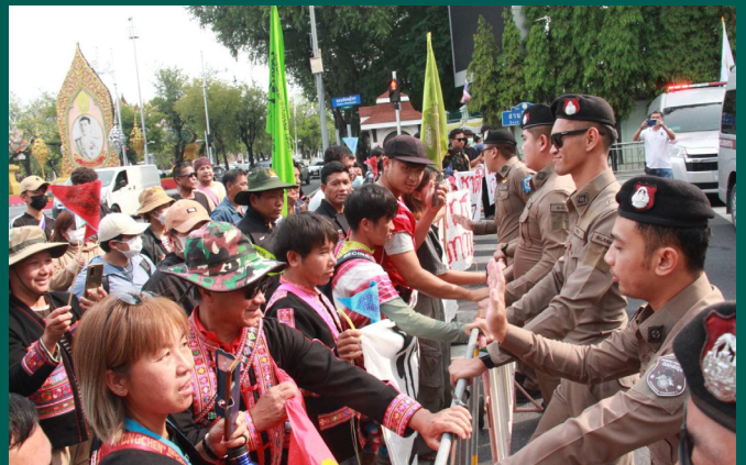
La policía no permitió a los manifestantes acercarse a menos de 50 metros de la Casa de Gobierno.

Tras 30 años de luchas locales y negociaciones internacionales, nuestros derechos colectivos se afirmaron finalmente en la Declaración de las Naciones Unidas sobre los Derechos de los Pueblos Indígenas (DNUDPI) en 2008. Estos derechos incluyen nuestro derecho a la autodeterminación, a nuestras tierras, territorios y recursos, a nuestros propios sistemas sociales, políticos y económicos, a nuestro camino hacia el desarrollo, a nuestra integridad cultural, junto con nuestras lenguas, identidades distintivas y estilos de vida.